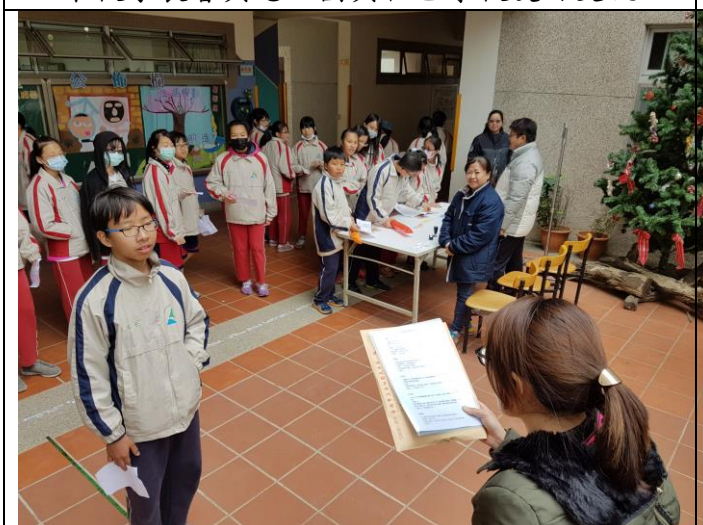
家庭教育有獎徵答活動— 學生場