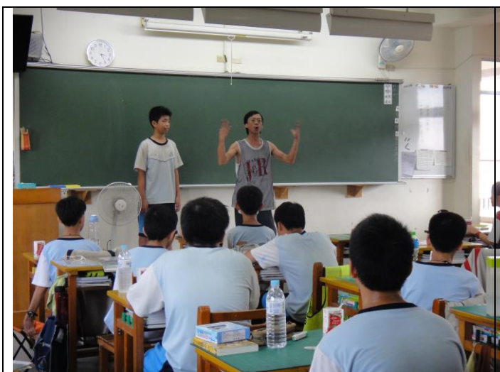
家長班級分享講座— 結合生涯發展教育