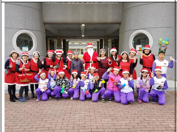
學東國小聖誕節感恩活動— 本校家長會與志工團與社區學校友好交流