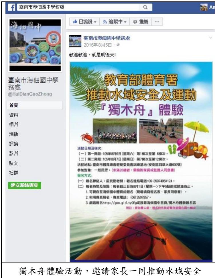
獨木舟體驗活動，邀請家長一同推動水域安全