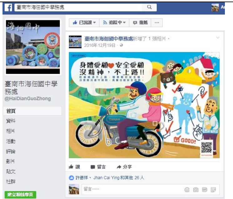
本校臉書透過文宣宣導交通安全