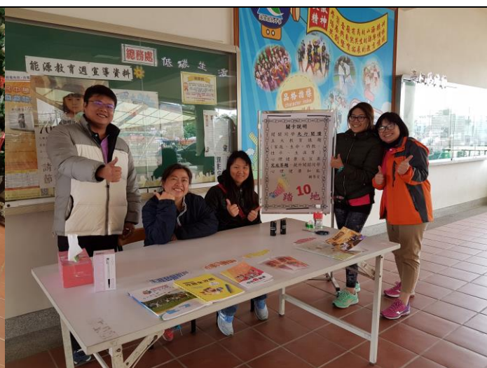
家庭教育有獎徵答活動— 家長場