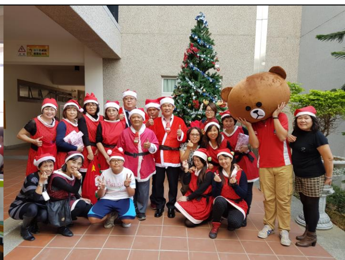
本校聖誕節感恩活動— 家長會與志工團共襄盛舉