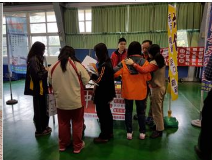
家長參與本校技職博覽會