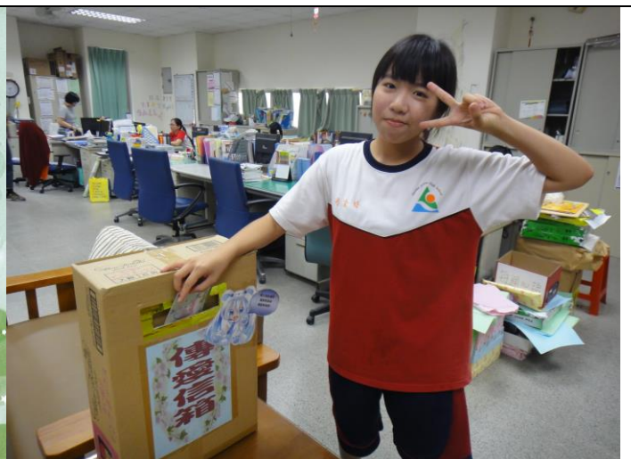
學生投遞傳愛信箱