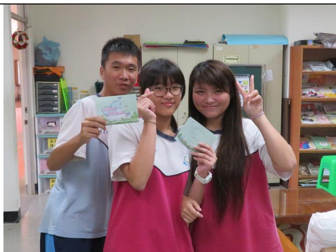
學生熱情參與活動