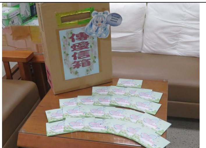
學生投遞之明信片