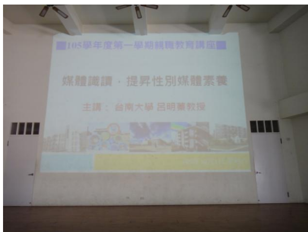
媒體識讀素養講座