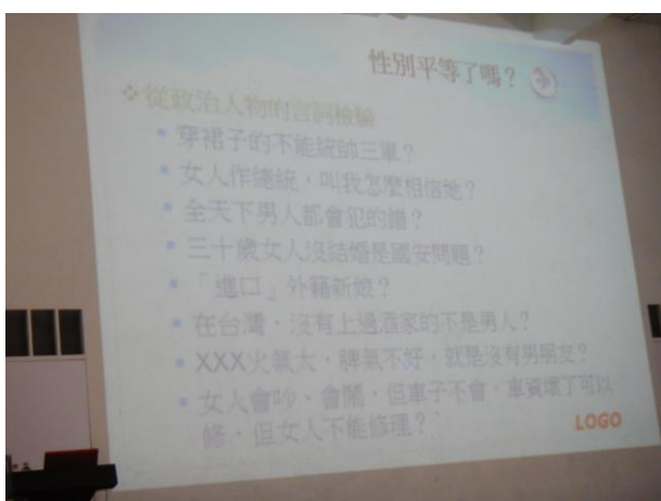
性別觀念在生活中的例子